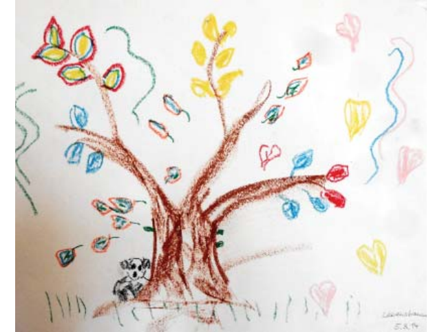
C. Kreutzmann „Lebensbaum“